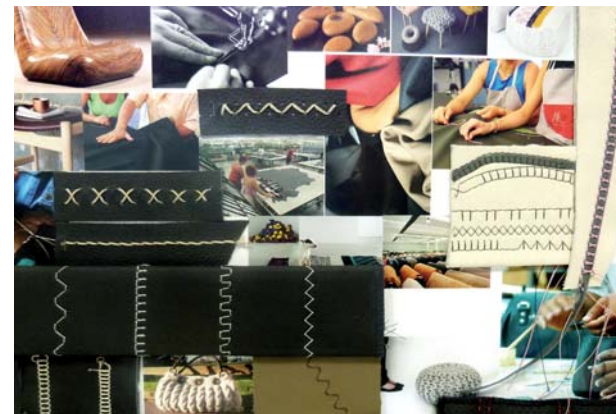
Immagini di mood board con ispirazioni dal mondo della moda, alcuni campioni di pelli ed esempi di impunture con diverse tipologie di trama estetica.